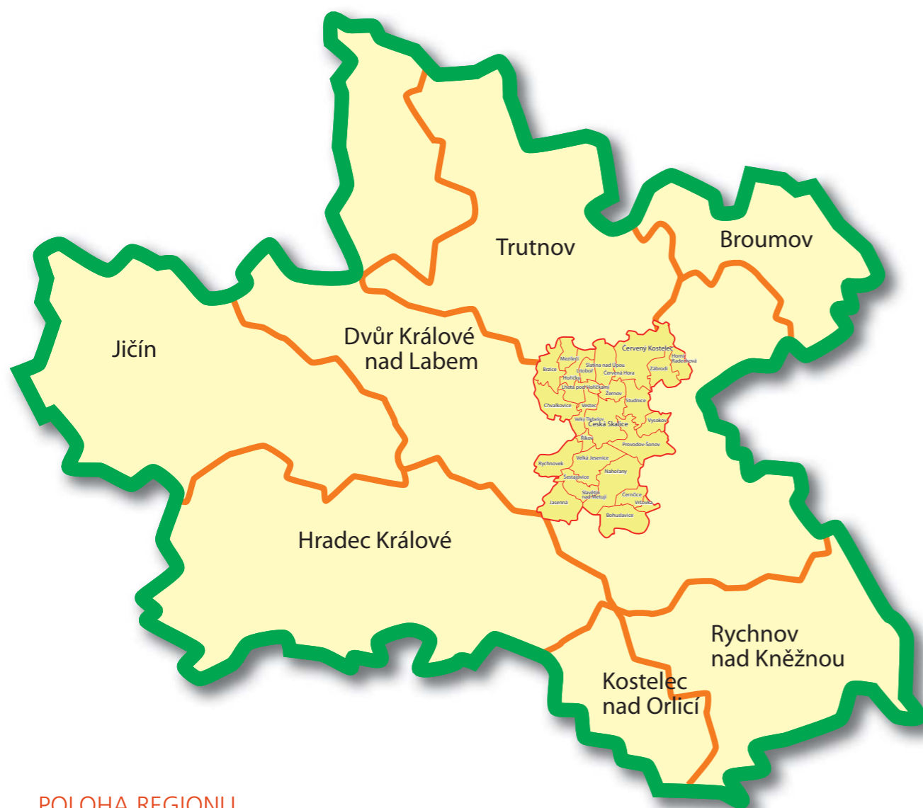
POLOHA REGIONU V RÁMCI KRÁLOVÉHRADECKÉHO KRAJE